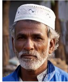
(Representative photo)