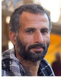
(Representative photo) Photo Source: Faysal Khan - Pixabay Send us a photo of this people group