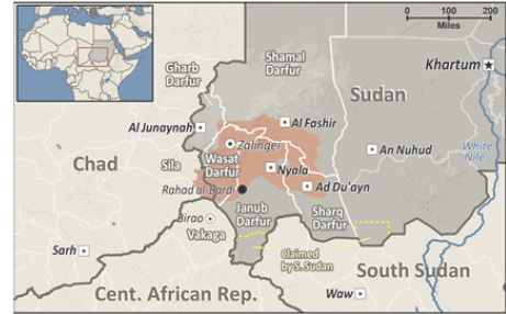
Fur in Sudan

People Group Location from IMB. Other Map Data/Geography from GMMSS (GMI). Map by Joshua Project