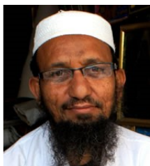
(Representative photo) Photo Source: Copyrighted © 2024 Isudas All rights reserved. Used with permission