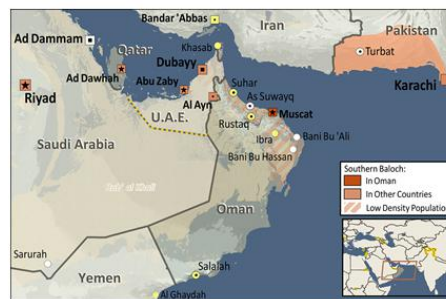
Baloch, Southern in Oman